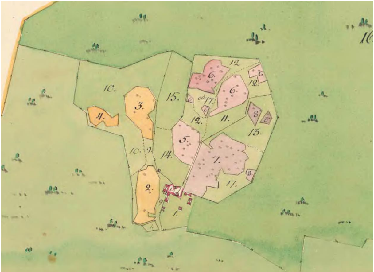
torp hör också torpet Hultamon